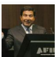
Intima la AFIP a titulares de