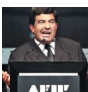
La AFIP comenzó a