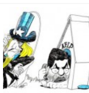
La AFIP negocia un