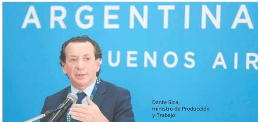
Dante Sica, ministro de Producción y Trabajo

Desde Banco Itaú, en tanto, afirmaron que colocaron el total cupo que les habían asignado y pidieron un adicional. Mientras que fuentes del Banco Ciudad comentaron que,