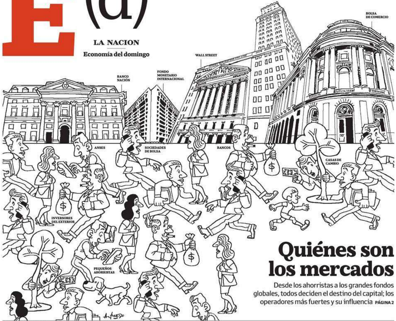
ILUSTRACIÓN ALFREDO SÁBAT