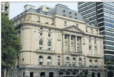
CUSTODIA. El trámite se verifica en la Bolsa de Valores.