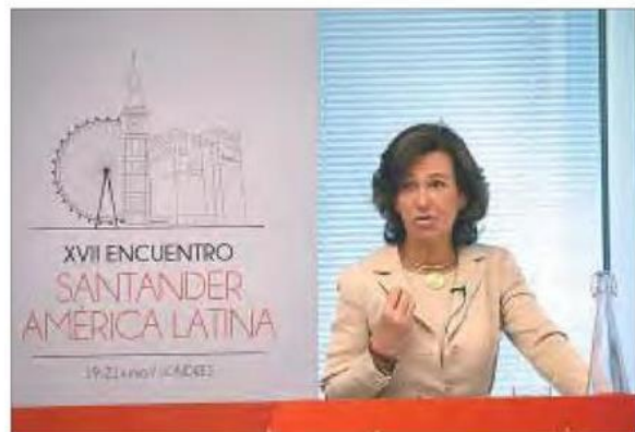
Ana Botín, presidenta del Grupo Santander

La banquera reconoció que la suba de tasas de la Fed al 3% esperada para 2019 afectará el crecimiento de la región, pero destacó su impacto: "Vemos que Latinoamérica podrá crecer -0,5% el próximo año. Pero la región está más fuerte de lo que estaba. Tenemos países con instituciones mejoradas, mercados de capitales desarrollados, bancos centrales con reservas sustanciales, como son los casos de Brasil y México", detalló.