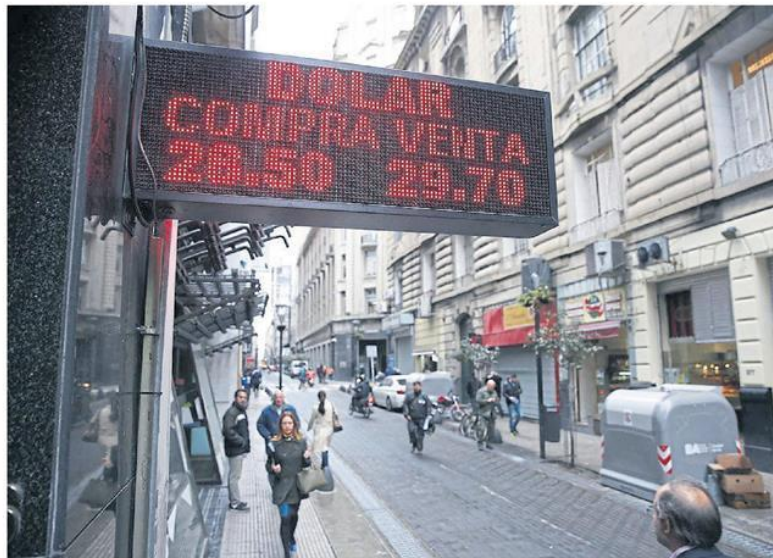
En la apertura, el dólar aún mostraba ayer la escalada del viernes; al final bajó a $29,04 FERNANDO MASSORRO