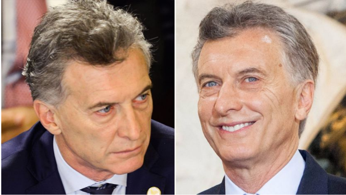
Mauricio Macri