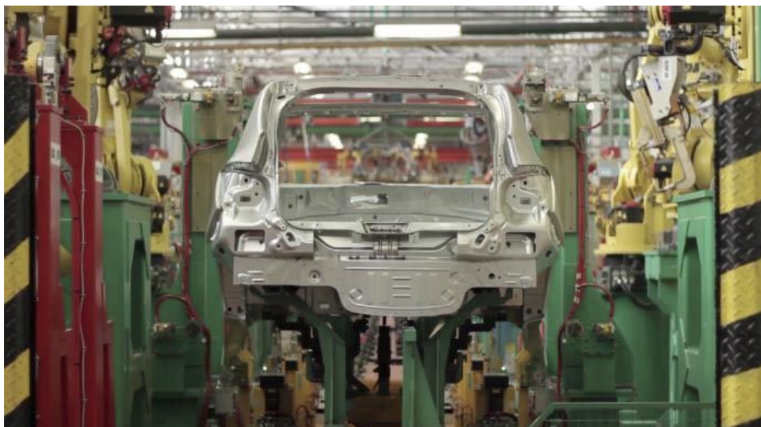
La industria no se recupera, debido al bajo consumo interno y las altas tasas.

En cuanto a las deudas para con la industria, Dragún explicó: “Argentina necesita una política de industria 4.0 . Hay intentos, pero necesitan ser articulados y considerados prioridad de Estado, para crecer con base tecnológica y científica, con un sistema educativo acorde. Que lo fiscal no tape lo productivo y que lo productivo sea pensado a largo plazo”.