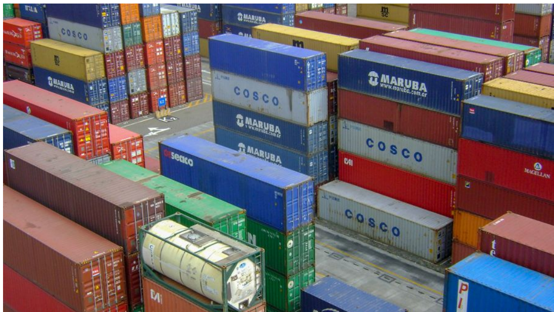
El comercio exterior no logra despegar.

Por otra parte, indicó: " No se han visto aún resultados de una mejora en la inserción económica internacional. Argentina va a exportar este año en niveles que son muy bajos en relación a lo que deberíamos lograr".