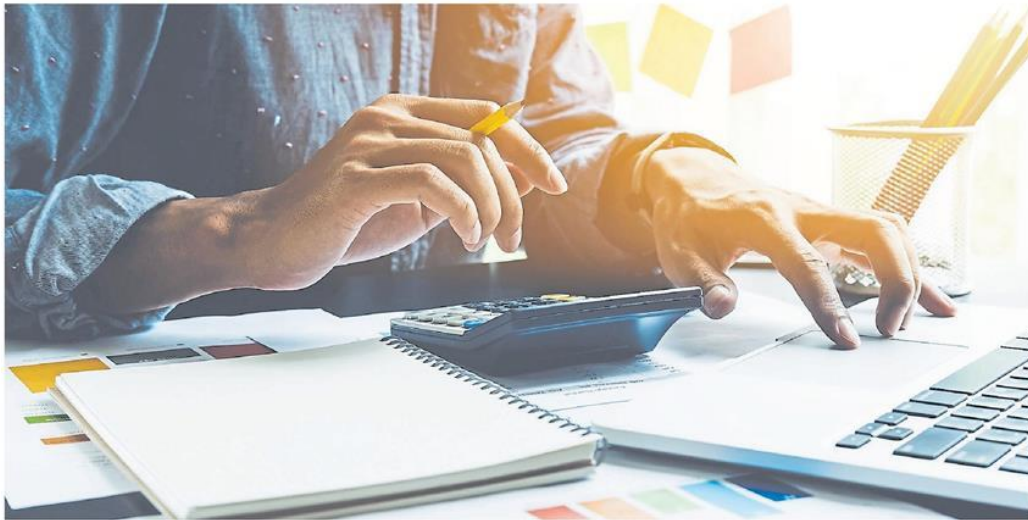
La ley prevé deducciones más conocidas y otras más recientes y menos difundidas