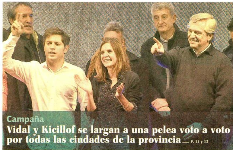
Campaña Vidal y Kicillof se largan a una pelea voto a voto por todas las ciudades de la provincia — P. 11 y 12

La Administración Federal de Ingresos Públicos (AFIP) tiene bajo análisis la aplicación de una retención del Impuesto a las Ganancias y a los Bienes Personales para las operaciones de compraventa de inmuebles que se cancelan a través de pagos con efectivo. La medida responde a evitar situaciones de evasión tributaria y de lavado de dinero, pero también a cuestiones de seguridad pedidas por el Colegio Público de Escribanos. — P. 7