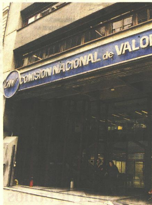
La CNV, centro de las críticas de los agentes de mercado