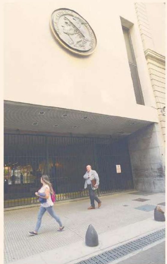
Habrá más brecha entre MEP y blue, pero no de inmediato.

El analista Christian Buteler señala que el puré de comprar el oficial y revenderlo en el blue deja $ 4000, “entonces tal vez no impacte en el blue al principio, pero luego puede tener una suba mayor que en el MEP y el CCL, que posiblemente dejen de crecer tanto”.