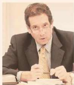
BCRA. Pesco quiere calma cambiaria.