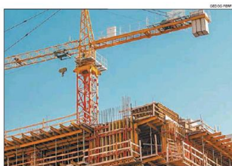
OBRAS. El 22% están paradas y hay otro tanto con demoras.

El 64% de las empresas fueron incluidas en el programa ATP en mayo, mientras que