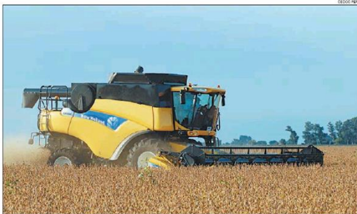
AGRO. Los productores se pasan a Paraguay, donde los rindes son menores, pero no hay retenciones.

Sectores. Las consultas que reciben alcanzan diseñadores, ingenieros, tecnológicas, desarrolladores de apps pero también maestros y profesores que brindan servicios a la región. "La caída de la ac-